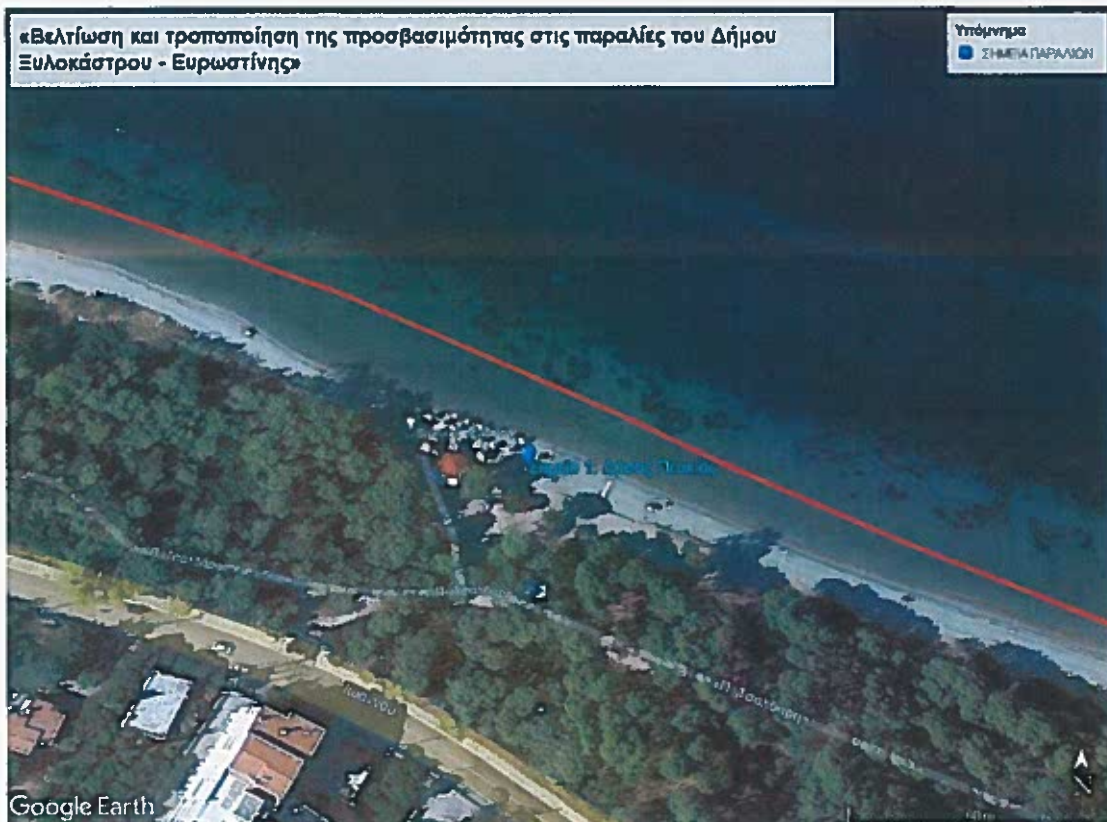
Εικόνα 2: Δάσος Πευκιάς-πλησίον καταστήματος Summer.