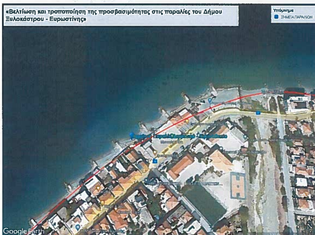
Εικόνα 5: Παραλία Μαρίνα Ξυλοκάστρου.