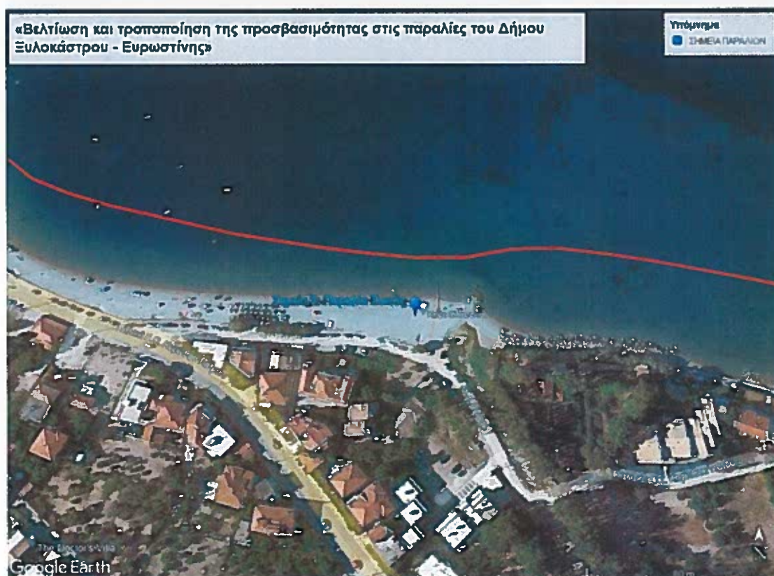
Εικόνα 3: Παραλία Συκιάς Ανατολικά.