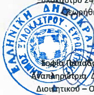
Εοφία Παπαδημητρίου Αναπληρώτρια Διευθύντρια Διοικητικού – Οικονομικού