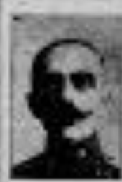
ΚΩΝΣΤΑΝΤΙΝΟΣ Α΄ ΒΑΣΙΛΕΥΣ ΤΗΣ ΕΛΛΑΔΟΣ