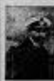
ΑΡΧΗΓΟΣ ΤΗΣ ΕΛΛΗΝΙΚΗΣ ΣΤΡΑΤΕΥΣΕΩΣ