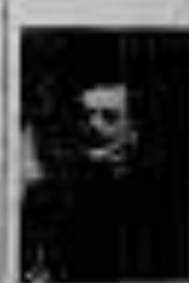
ΑΡΧΗΓΟΣ ΤΗΣ ΕΛΛΗΝΙΚΗΣ ΝΑΥΤΕΥΣΕΩΣ